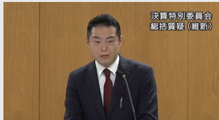
決算特別委員会 総括質疑（維新）

決算特別委員会総括質疑で区のガバナンス体制について質問しました。品川区は先進的な取組みを多く行っていますが、同時に組織体制を強化していかなければ足元をすくわれることになりかねません。弁護士として企業法務で培ってきた知見を活かし、